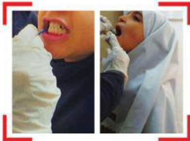
۳- برگزاری مرحله دوم فلوراید تراپی دبستان دخترانه تهران