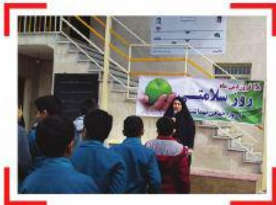
۴- برگزاری پویش همگانی سلامت به مناسبت روز جهانی بهداشت دبستان پسرانه دماوند