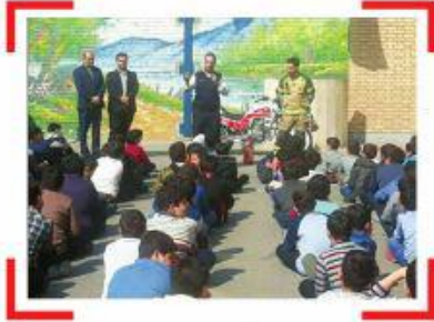
۲- برگزاری کلاس آموزش پیشگیری از خطرات چهارشنبه آخر سال دبستان پسرانه تهران