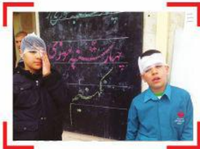
۱- برگزاری کلاس آموزش پیشگیری از خطرات چهارشنبه آخر سال دبستان پسرانه دماوند