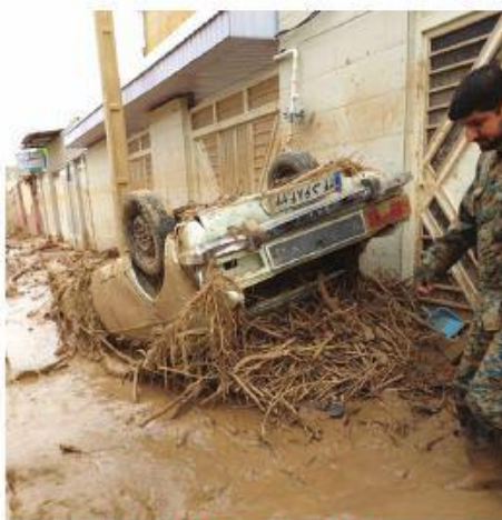
تصاویر اختصاصی از مناطق سیل زده

صبح روز هفتم فروردین ماه سال ۱۳۹۸ بود، هوا ابری بود و نم نم باران میزد، با اندک وسایل شخصی اما با بار و بنه فراوان که شامل برنج و حبوبات و رب و ادویه جات و روغن بود در کنار دوستان که همگی با همسر خود آمده بودند، راهی مناطق سیل زده شمال کشور شدیم با توقف، ۶ ساعتی در راه بودیم. وسایل پخت و پز روز قبل در شهر آماده شده بود؛ من و یکی دو نفر از دوستان به سمت آق قلا رفتیم یک ساعت و نیم زمان برد تا رسیدیم به قسمتی که دیگر نمیشد با ماشین رفت.