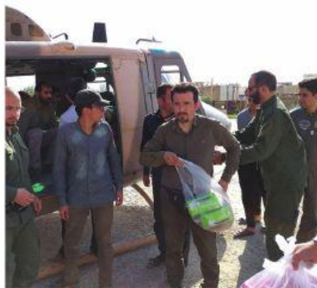
تصاویر اختصاصی از مناطق سیل زده

داشت. بعد از بازگشت از بندر گز برنامه ریزی و هماهنگی شد تا سفری کوتاه برای بررسی وضعیت در شهرستان های معمolan و پلدختر استان لرستان انجام شود که در نهایت پانزدهم فروردین عازم شدیم، سه نفر بودیم و تقریباً ۱۰ ساعتی در راه بودیم تا به محل رسیدیم؛ با بچه های سپاه پلدختر جلسه کوتاهی داشتیم و سریعاً محل استقرار نیروها را هماهنگ کردیم و بررسی میدانی انجام دادیم تا نیروها از روز جمعه شانزدهم فروردین شروع به کار کنند.