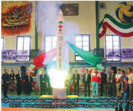
این اثر ماکت موشک بالستیک سجیل، ساخته گروه ماکت سازی ذوالفقار دبستان شهدای مولفه اسلامی ۳ جیل ماکت انقلاب، مانور یاوران انقلاب اسلامی اداره آموزش و پرورش شهرستان دماوند، ۱۳۷۷/۱۰/۱۵

همچنین گروه سرود عاشقان ولایت به همراهی موسیقی زنده به اجرای سرودی در رثای بانوی دو عالم حضرت فاطمه زهرا(س) پرداختند و در پایان گروه ماکت‌سازی ذوالفقار از ماکت موشک بالستیک سجیل رونمایی کرده و به صورت نمادین آن را پرتاب نمودند.