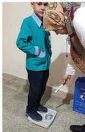
۲- انجام معاینات BMI دبستان پسرانه دماوند