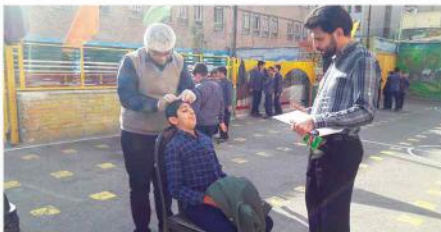
۱-انجام معاینات پدیکلوز (شش سر) دبستان دوره دوم تهران