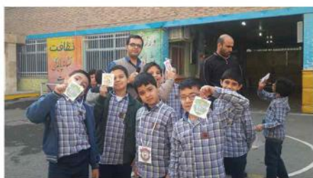
۳- اهدای کارت سفیران سلامت دبستان دوره اول تهران