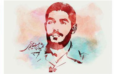
پهلوان شهید ابراهیم هادی

تولد: اول اردیبهشت سال ۱۳۳۶ در محله شهید سعیدی حوالی میدان خراسان شهادت: ۲۲ بهمن سال ۶۱، فک - بای یادبود: ۲۶ گلزار شهدا بهشت زهرا (س)