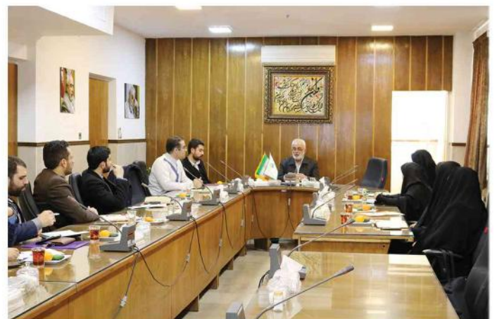
جلسه عمومی اعضای دوهفته نامه - زمستان ۱۳۹۷